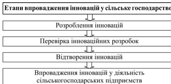
Рис. 2. Основні етапи впровадження інновацій у сільське господарство

Доцільно зазначити, що можливість впровадження інновацій у сільське господарство є вагомим стимулятором зростання національної економіки загалом та засобом вирішення різноманітних соціально-економічних та глобальних викликів у цій сфері. Загалом в економічній практиці, впровадження інновацій у сільське господарство розглядають як процес, який складається із взаємопов'язаних послідовних етапів: розроблення інновацій, їх перевірка, відтворення та впровадження у діяльність (рис. 2).