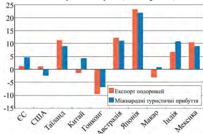
Рис. 1. Провідні експортери туристичних і міжнародних туристичних подорожей, 2016 р.

Азійські економіки продемонстрували найбільший приріст міжнародних туристів, переважно пасажирів, які подорожують у межах регіону. Це зростання зумовлено розвитком повітряного зв'язку та дешевими авіаперельотами. Міжнародний туризм в Азії збільшив експорт послуг в регіоні на 5 %, що забезпечило найвищий приріст серед регіонів світу. Декілька провідних і нових азійських експортерів туристичних послуг виявили стійкі темпи зростання – Японія, Австралія, Таїланд та Індія (див. рис. 1). Китай відіграв ключову роль у зростанні туризму сусідніх країн у 2016 р. Китайські мандрівники орієнтувалися на цільові пункти призначення в межах Азії, вважаючи за краще короткі поїздки на великі відстані. У 2016 р. Китай отримав 21,8 % від загальної суми плати за міжнародні подорожі (Working, 2017).