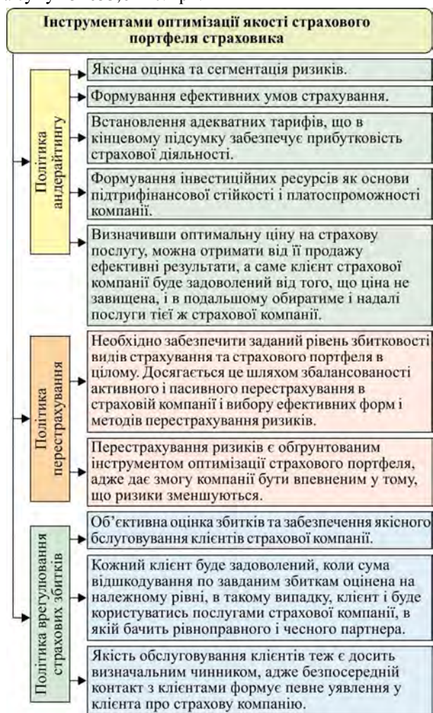
Рис. 2. Інструменти оптимізації страхового портфеля страхових компаній в сучасних умовах

вимоги до перестраховиків, 16 % – нерухоме майно, 4 % – акції дочірньої компанії. Перевищення чистих активів над величиною статутного капіталу становить 335453,4 тис. грн. Станом на 31.12.2017 р. фактичний запас платоспроможності становить 616416,6 тис. грн, що перевищує нормативний запас платоспроможності на суму 452053,6 тис. грн.