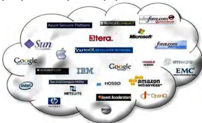
Рис. 2. Перспективність розвитку хмарних сервісів для великих гравців ІТ-ринку

Нагадаємо, що фішинг (англ. Phishing – рибальство) – вид шахрайства, метою якого є виманювання у довірливих або неуважних користувачів мережі Інтернет персональних даних клієнтів он-лайн аукціонів, сервісів з переказу або обміну валюти, інтернет-магазинів. Фішинговий сайт – це шахрайський веб-ресурс, який виманює реквізити платіжних карток під виглядом надання послуг, що не існують (наприклад, поповнення мобільного рахунку, переказів з картки на картку), або веб-ресурс організації, якій користувач довіряє (наприклад, клон інтернет-банку), що має на меті збирання реквізитів платіжних карток для подальшої крадіжки грошових коштів з рахунків отримувачів платіжних карток. Більше 90 % фішингових сайтів надають фіктивні послуги з поповнення мобільного рахунку та переказу коштів з картки на картку.