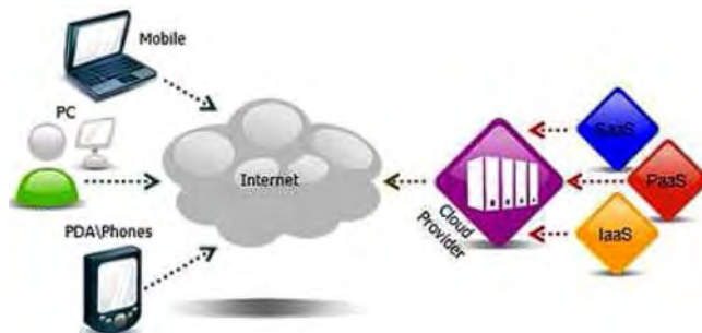
Рис. 1. Схема організації роботи за допомогою хмарного сервісу

Потреба використання терміну "хмара". Багатоох студентів молодших курсів цікавить, чому сервіси віддалених обчислень і оброблення даних називають саме "хмарними" [23]. На це запитання є декілька відповідей. Передусім, традиційне зображення мережі Інтернет на діаграмах комп'ютерних мереж виконують саме у вигляді "хмари" (рис. 1). Водночас, "хмара" – це символ віддаленості від конкретного користувача. Окрім цього, "хмара" – це образ складної комп'ютерної інфраструктури, за якою ховаються всі технічні деталі її реалізації. Так що термін "хмара" – це, грубо кажучи, метафора, яка прижилася в ІТ-індустрії як один з найбільш вдалих термінів (за винятком нудного слова "віддалені"), що передає суть самого явища як такого. Хоча для студентів-початківців така назва часто вводить їх у ступор, а інколи й стимулює дізнатися, врешті-решт, що ж це за таке "хмарні сервіси". Адже хмарний сервіс дає змогу його користувачам працювати навіть з пристроєм, спочатку зовсім не призначеним для виконання такого виду робіт.