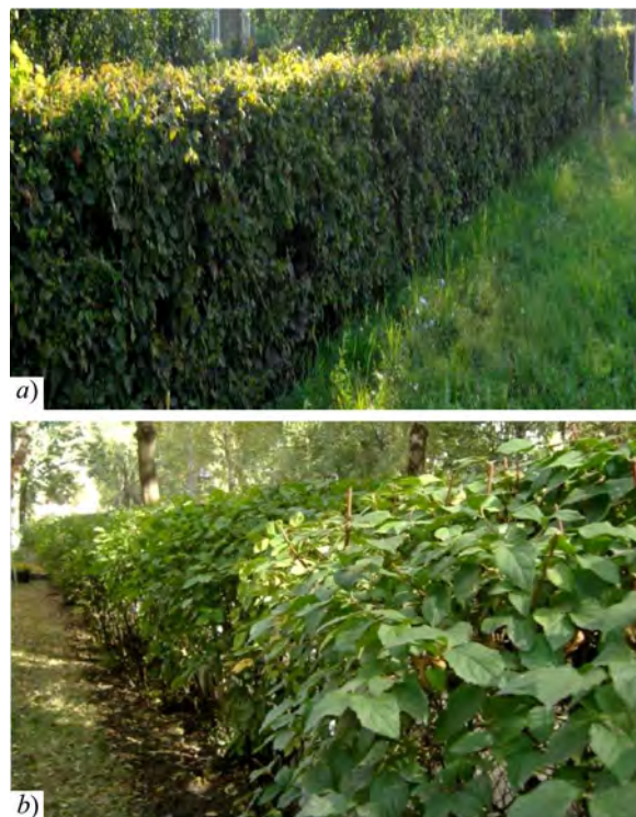
Рис. 1. Живоплоти вздовж магістральних вулиць м. Чернівці / Hedges along the main streets of Chernivtsi: a) живопліт зі свидини білої / white dogwood hedge; b) живопліт із граба звичайного / european hornbeam hedge

Матеріали та методи дослідження. Для дослідження відбирали зразки листя найпоширеніших для живоплотів цього регіону видів: свидини білої ( Cornus alba (L.) Opiz., рис. 1, a), граба звичайного ( Carpinus betulus L., рис. 1, b) та пухироплідника калинолистого ( Physocarpus opulifolia L.), що зростають на території парків, скверів, вздовж віддалених мало завантажених селищних вулиць та у найскладніших умовах антропогенного впливу – вздовж головних вулиць Чернівців. Умовним контролем (I ЕФП) було обрано створений для експериментів живопліт у наближених до природних присадибних умовах у смт Берегомет.