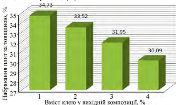
Рис. 5. Залежність набрякання плит за товщиною від вмісту клею у вихідній композиції / Dependence of swelling of the plates in thickness on the amount of glue in the original composition

Вплив вмісту клею на набрякання плит за товщиною наведено на рис. 5. Ця залежність має обернено пропорційний характер, що пояснюють тим, що зі збільшенням кількості в'язучого виникає більша кількість зв'язків між структурними частинками матеріалу, які компенсують напруження, пов'язані з набряканням і, відповідно, зменшують деформації.