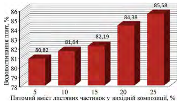
Рис. 3. Залежність водопоглинання плити від вмісту опалого листа у вихідній композиції / Dependence of water absorption of the plate on the content of fallen leaves in the original composition

Вплив вмісту опалого листа на водопоглинання плити наведено на рис. 3. Як видно з діаграми, зі збільшенням частки листяної сировини водопоглинання плит зростає. Ця залежність близька до лінійної, причому зростання водопоглинання у діапазоні від 20 до 25 % є більш інтенсивне. Таку закономірність пояснюють тим, що за більшого вмісту листяних частинок зростає пористість матеріалу, а це зумовлено підвищеною пористістю листа.