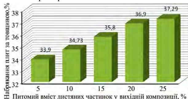
Рис. 2. Залежність набрякання плити за товщиною від вмісту опалого листа / Dependence of the swelling of the plate in thickness on the content of fallen leaves

Вплив вмісту листяних частинок у вихідній композиції на набрякання плит показано на рис. 2. Як видно з діаграми, зі збільшенням частки листяної сировини набрякання плит спадає. Це пояснюють компенсацією деформацій, зумовлених набряканням більшою кількістю пор у листі порівняно із деревиною. Залежність має лінійний характер.