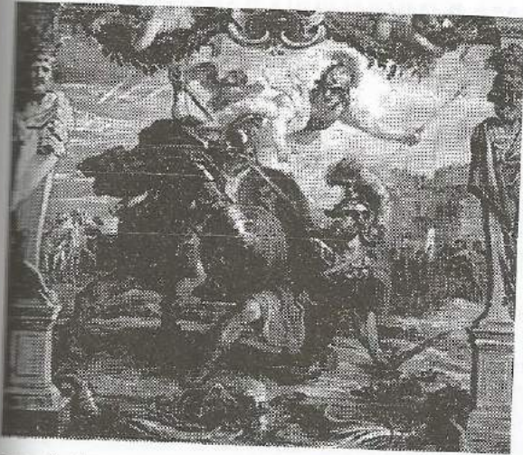
Рис. 5. Ахиллес смертельно ранит Гектора в шею. Питер Пауль Рубенс (1630-1635)

...И в чело устремленного острым копьем Агамемнон Гранул, копия не сдержал ни шлем его меднотяжелый: Быстро сквозь медь и сквозь кость пролетело и, в череп ворвавшись, С кровью смешало весь мозг и смирило его в нападеньи...