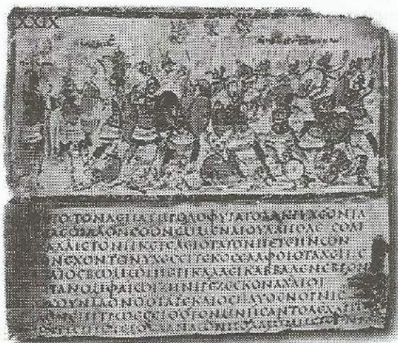
Рис. 4. Страница Илиады с изображением троянской войны. 5–6 век до н.э. Милан, Biblioteca Ambrosiana

В начале Илиады описано сражение между ахейцами и троянцами. В поэме ярко представлена реальная жизнь и быт племен древней Греции со значительным преобладанием описания быта военного времени. Причем, поэма насыщена изображением сцен смерти, жестоких ранений и предсмертных конвульсий. Гомер яркими и реалистическими красками воспроизводит сцены насилия и беспощадной жестокости победителей. Чаще всего, битва изображается не как массовая батальная сцена, а как поединок между отдельными героями, отличающимися особым воинским искусством [1, 8].