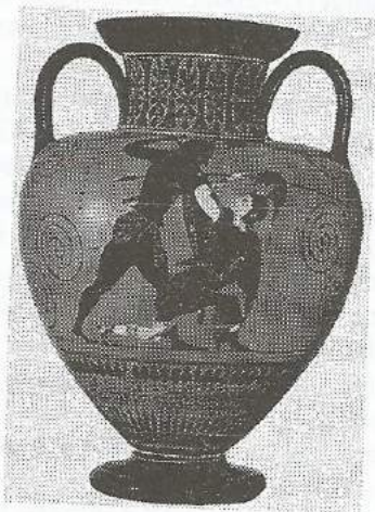
Рис. 6. Амфора с изображением Ахиллеса и Пен-тесилеи. Древняя Греция. Около 530 г. до н.э.