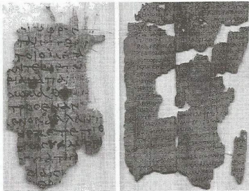
Рис. 1. Оригинальный текст Илиады Гомера. 332–330 до н.э., написанный на папирусе

Поэма была создана в Ионии, самой развитой из тогдашних греческих областей, то есть, в полисах вдоль побережья Малой Азии. Сюжетом гомеровской поэмы являются разные эпизоды троянской войны. Датировка Троянской войны является спорной, однако большинство исследователей относят её к XIII–XII вв. до н.э. Источником поэмы были сказания Древ-