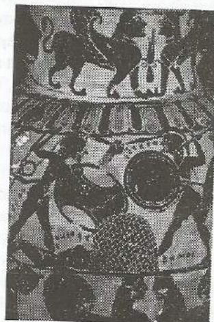
Рис. 7. Поединок между Ахиллесом и Гектором. Черная амфора из Аттики 550 до н.э. Мюнхен, Германия