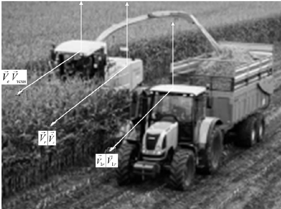
Рис. 1. Представление технологической операции в виде многокомпонентного сложного движения.

двигателя трактора и скоростью увеличения массы груза в тракторном прицепе по мере выполнения технологической операции. Однако задачу можно было решить иным способом. Движение комбайна [3] можно было представить, как сложное движение, причем переносным необходимо представить равномерное движение машины с заданной технологической скоростью (рис 1).