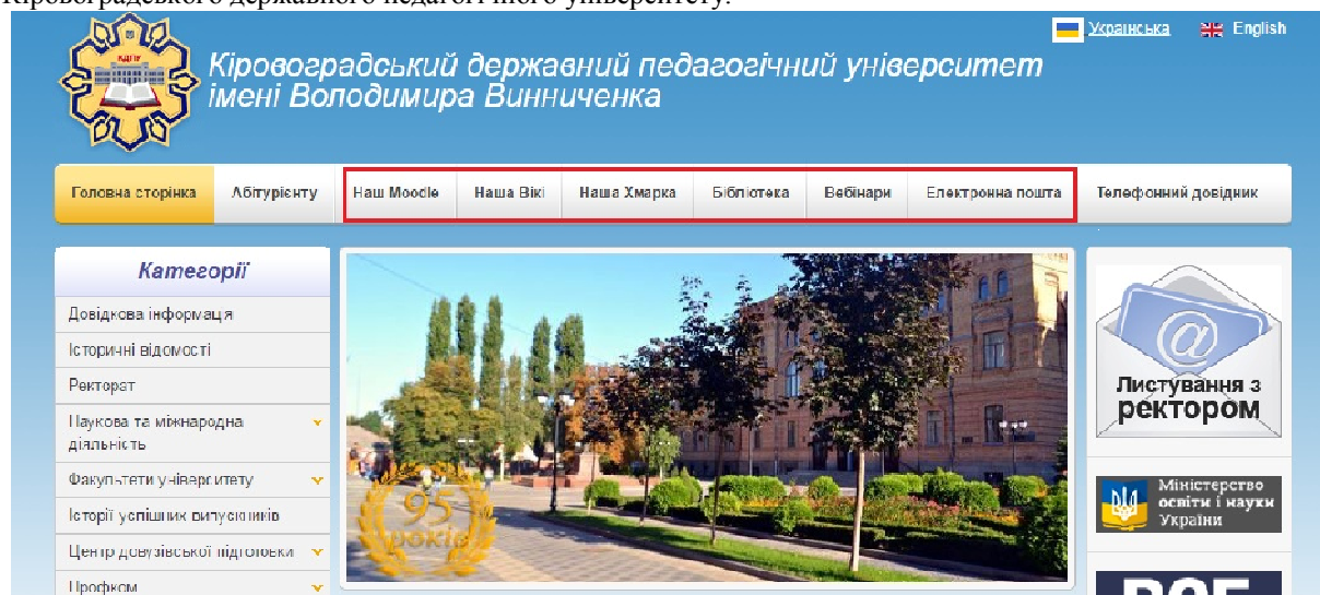
Рис. 1. Веб-сайт КДПУ

Метою статті є опис ресурсів, що складають інформаційну інфраструктуру КДПУ, та способу їх інтеграції через створення єдиної системи автентифікації користувачів у інформаційний освітній простір Кіровоградського державного педагогічного університету.