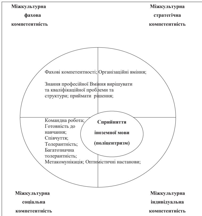
Рис. 2. Площина моделей міжкультурної компетентності (5)

Міжкультурні компетентності, наведені на рис. 2, необхідні для того, щоб вміти діяти чуйно, рефлексивно, адекватно та ефективно в ситуаціях міжкультурного перетину – у взаємодії з представниками інших культур.