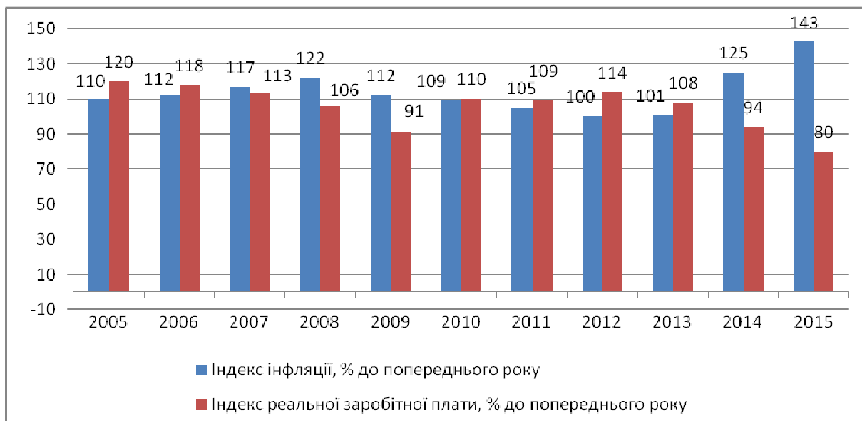
Рис. 3 Динаміка індексів інфляції та реальної заробітної плати, 2005-2015 рр. Джерело: Державна служба статистики в Україні http://www.ukrstat.gov.ua

Прискорення темпів інфляції в 2014 та 2015 роках, відповідно на 24,9% та 43,3% та скорочення реальної заробітної плати за цей же період, відповідно на 6,5% та 20,2% негативно вплинули на рівень як трудових, так і нетрудових доходів населення, що призвело до підвищення рівня бідності населення тільки за один рік на 75% – з 3,3% у 2014 році до 5,8% у 2015 році та помірної бідності відповідно: з 15,2% до 22,2% (Рис.3).