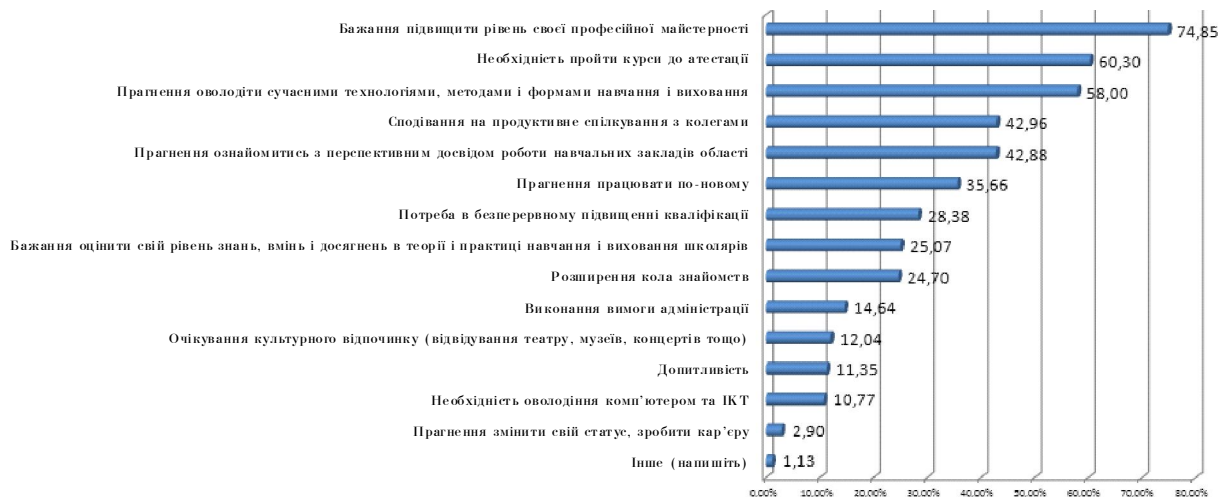
Рисунок 1. Основні мотиви навчання педагогів на курсах підвищення кваліфікації, %

й цікавого для себе (63 % респондентів), підвищили теоретичний рівень фахових знань (59 %), познайомилися з творчими педагогами та їх досвідом (52 %), отримали необхідні консультації від працівників ВІППО – кожен другий опитаний; оволоділи новими формами і методами роботи (44 %), оволоділи елементами нових освітніх технологій (39 %), ознайомилися з перспективним досвідом роботи шкіл області (30 %). Якщо серед мотивів перебування на курсах необхідність оволодіння комп'ютером важливою була для 10,8 % респондентів, то як результат перебування на курсах 14,8 % респондентів відзначили, що вони розширили свої знання і вміння користування комп'ютером.