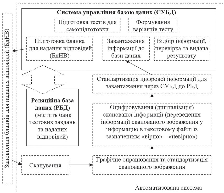
Рис. 1. Блок-схема автоматизованої системи підготовки і перевірки тестових завдань

Процеси сканування, графічного опрацювання та оцифрування сканованої інформації не були автоматизовані з допомогою СУБД, оскільки в її функціонуванні така робота не передбачена. Нами запропоновано здійснювати процес сканування у кольоровому режимі, роздільною здатністю від 300 пікселів на дюйм та з використанням пристрою, що забезпечує автоматичну подачу нового аркуша і зберігає інформацію у форматі jpg (рис. 2, а).