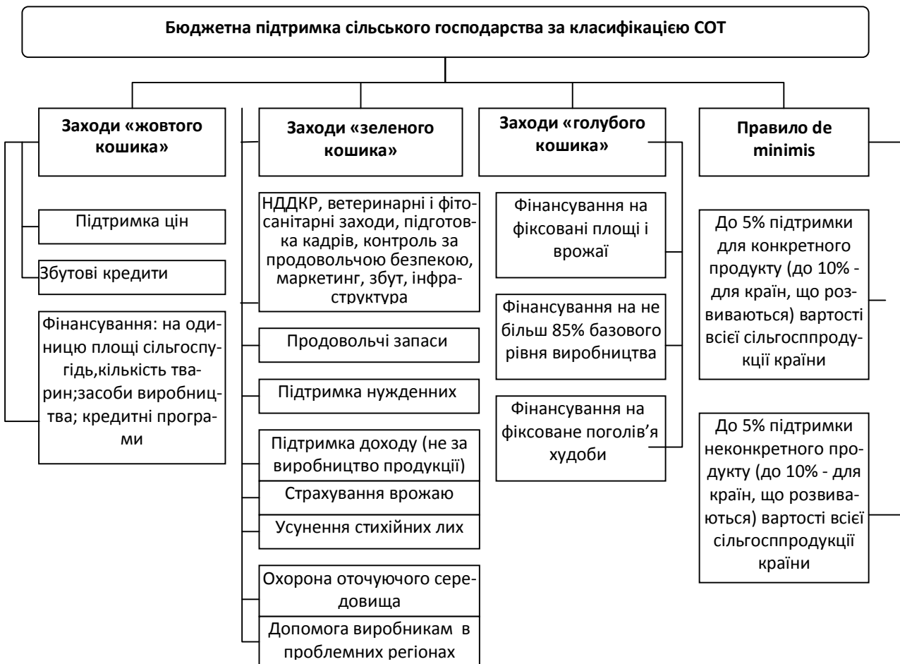
Рисунок 1 – Модель державної підтримки сільгосптоваровиробників по класифікації СОТ

Для сільського господарства України в умовах СОТ державне регулювання з метою забезпечення продовольчої безпеки країни життєво необхідне, оскільки аграрний сектор функціонує в складних економічних умовах. Тому на сучасному етапі державна підтримка повинна мати певну спрямованість: переорієнтація на посилення інвестиційної активності різке збільшення довгострокового кредитування; збільшення в бюджетах всіх рівнів частки підтримки реалізації сільгосппродукції виробниками. Одночасно варто враховувати, що країни-члени СОТ повинні забезпечити вільний доступ на свій ринок сільськогосподарських продовольчих товарів. Модель державної підтримки сільськогосподарського виробника по класифікації СОТ представлена на рис.1.