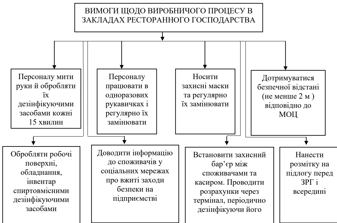
Рис. 3. Рекомендації щодо виробничого процесу

Для виробництва головними повинні залишитися підвищені санітарно-гігієнічні вимоги відповідно до МОП, МОЗ України та ВОЗ (рис. 3).