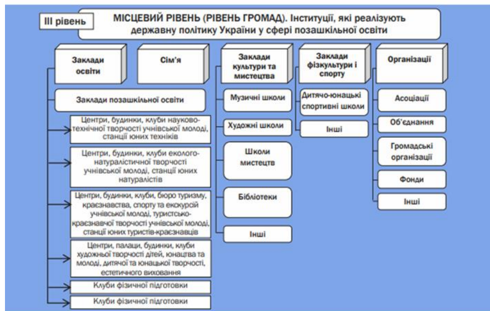
Рис. 1. Система позашкільної освіти в Україні на місцевому рівні (Биковська, 2018)

Метою Стратегії розвитку позашкільної освіти в Україні є підвищення якості і доступності позашкільної освіти, розширення функцій закладу позашкільної освіти в адміністративно-територіальній одиниці як центру освітньої, соціокультурної та громадянської діяльності з урахуванням навчання впродовж життя (Биковська, 2018). Закон України «Про позашкільну освіту» (2000) відповідно до Конституції України визначає державну політику у сфері позашкільної освіти, її правові, соціально-економічні, а також організаційні, освітні та виховні засади. Система позашкільної освіти України як освітня підсистема охоплює державні, комунальні, приватні заклади позашкільної освіти, інші центри позашкільної освіти, гуртки, секції, клуби, культурно-освітні, спортивно-оздоровчі, науково-пошукові об'єднання на базі закладів загальної середньої освіти, фонди тощо (Закон «Про позашкільну освіту», 2000). Система позашкільної освіти в Україні реалізується на трьох рівнях: державному, регіональному та місцевому (рис. 1).