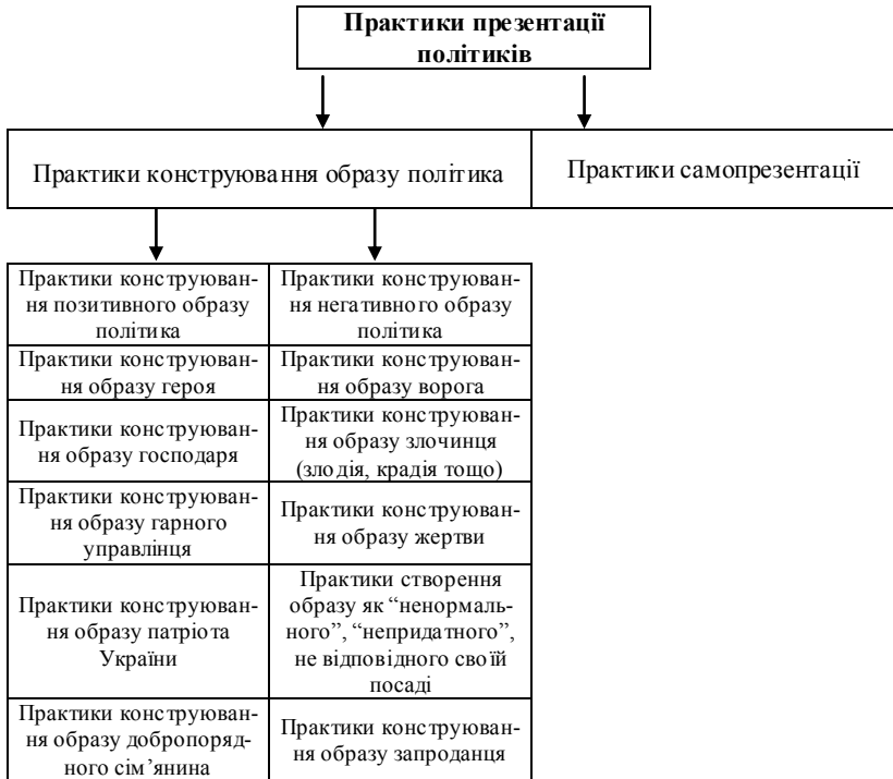
Рис. 2. Поділ політичних практик за характером презентації політика

● практика конструювання персонажа як ненормального (ідеться про створення такого образу, який займається “ненормальними”, “неналежними” справами, що не відповідають його посаді, статусу, ролі тощо). Наприклад, свого часу активно й саркастично мусувалася тема щодо, так би мовити, “дивного” хобі Віктора Ющенка, його нібито надмірного захоплення бджільництвом. Цікаво також додати, що, на думку М. Фуко, ті смисли, що пов’язані з ненормальністю, “роблять” персонаж наперед винним у всіх можливих “бідах”;