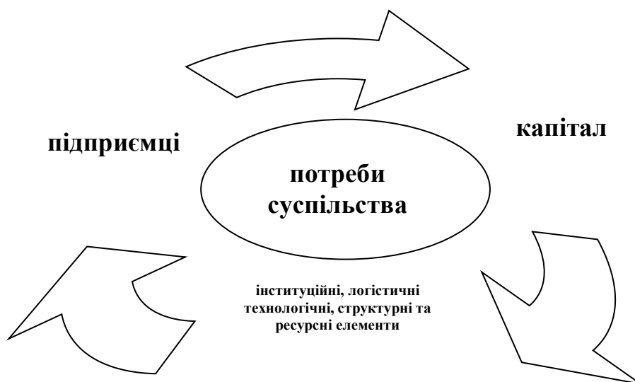
Рис. 1. Складові промислового потенціалу

Таким чином, капітал – це один із факторів промислового потенціалу, потрібний для виробництва в ринковій економіці, який стоїть між підприємцем і світом благ. Капітал складається із інституційних, логістичних, технологічних, структурних та ресурсних елементів. Схематично складові промислового потенціалу зображено на рис. 1.