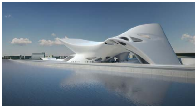
Рис.1. Nuragic and Contemporary Art Musum. Архітектор - Zaha Hadid

В умовах сучасної ринкової економіки особливо актуальна в галузі капітального будівництва тематика застосування ефективних будівельних матеріалів та конструкцій в будівлях і спорудах. В останні роки в будівництві громадських, промислових та сільськогосподарських споруд все частіше виникають завдання по розробці проблем теорії споруд. Все це пов'язано з великою технізованістю XXI сторіччя. Стрімкий розвиток технічного прогресу має вплив на всі галузі, в тому ж числі на архітектуру та будівництво. Виходячи з фактичного стану XXI століття, динамічність життя суспільства, пов'язана з неймовірними темпами науково-технічного прогресу, розширенням меж діяльності суспільства, посиленням міграції та рухомості населення, що сприяє змінам у всіх сферах людської діяльності, в тому числі в архітектурі, як матеріальному середовищі цієї діяльності.