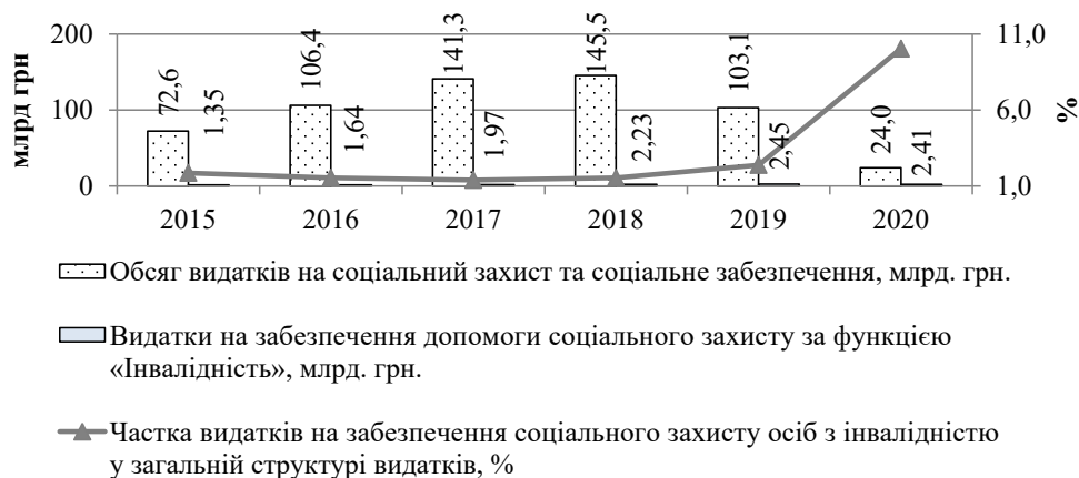
Рис. 3. Зміна обсягу видатків з місцевих бюджетів України на соціальний захист та соціальне забезпечення й частки видатків на забезпечення допомоги соціального захисту за функцією «Інвалідність» у 2015–2020 рр.

Оцінка бюджетного фінансування сфери соціального захисту населення в Україні показує, що негайного вирішення потребують такі питання, як удосконалення міжбюджетних відносин шляхом розширення повноважень місцевих громад у процесі розрахунку потреб у фінансо-