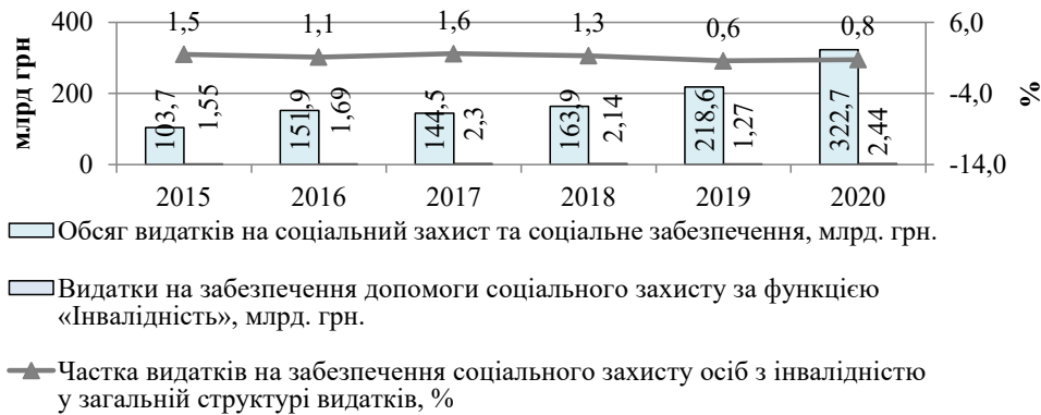
Рис. 2. Зміна обсягу видатків Державного бюджету України на соціальний захист та соціальне забезпечення і частки видатків на забезпечення допомоги соціального захисту за функцією «Інвалідність» у 2015–2020 рр.