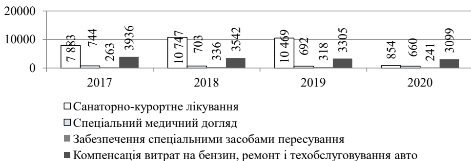
Рис. 5. Зміна кількості осіб з інвалідністю, забезпечених медико-соціальними послугами у 2017–2020 рр., осіб