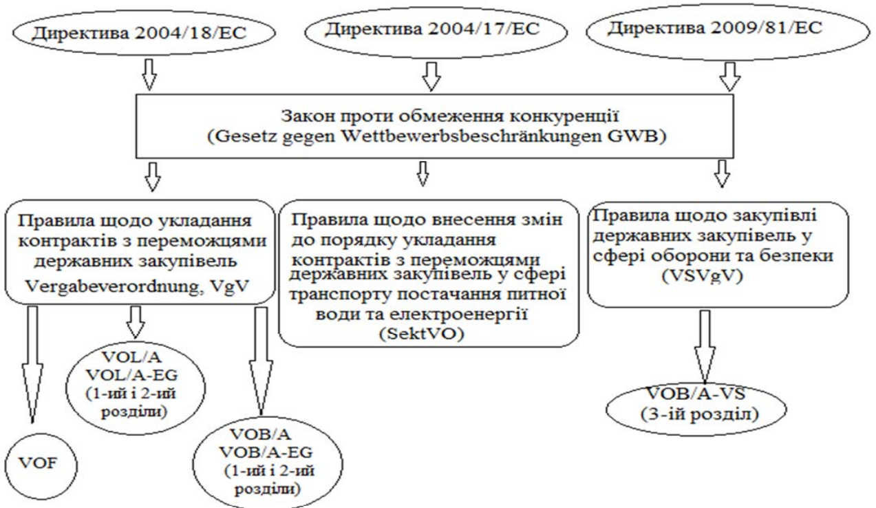
Рис. 2. Структура законодавства Німеччини у сфері державних закупівель