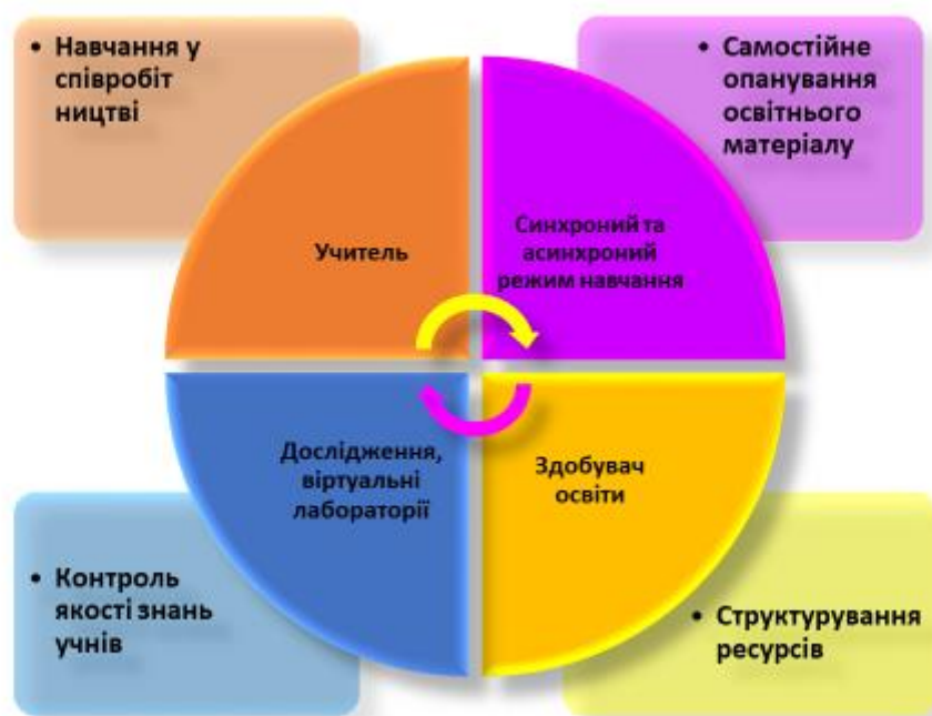
Рис. 4. Методика організації освітнього простору ЗСО в умовах змішаного навчання

Пріоритетними принципами організації змішаного навчання є самостійна робота здобувачів освіти, але ніяк не виключає сумісної діяльності вчителя та здобувача освіти на всіх етапах навчання, принципів рефлексивності та ефективності в освітньому процесі. На рис. 4 схематично показано, як використовується методика самоорганізованого освітнього простору, яка допомагає здобувачам освіти вдало організувати роботу за допомогою дистанційної платформи та отримати необхідну та корисну інформацію.