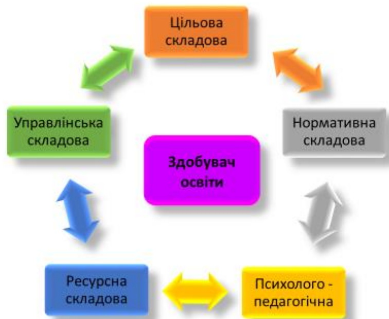
Рис. 3. Структура управління освітнім середовищем ЗЗСО в умовах змішаного навчання

управління закладами освіти. Вона визначає і задає специфіку організацію навчання і виховання ЗЗСО в умовах упровадження змішаного навчання (рис. 3). Нормативна складова містить законодавче, правове, нормативно-інструктивне забезпечення або їх комплексів та регулює процеси освіти різного рівня і призначення, в тому числі вибір навчальних планів, програм, форм здобуття освіти. Ресурсна складова утворена кадрами (вчителі, керівники підрозділів, вихователі, допоміжний персонал закладу освіти), енергетичними і фінансовими ресурсами, засобами навчання та оснащення приміщення, технологіями забезпечення їх придатності, безпечного використання та розвитку. Психолого-педагогічна складова утворена методами і засобами освітньої діяльності, що здійснюється в закладі загальної середньої освіти. Учнівську складову утворює склад контингенту ЗЗСО.