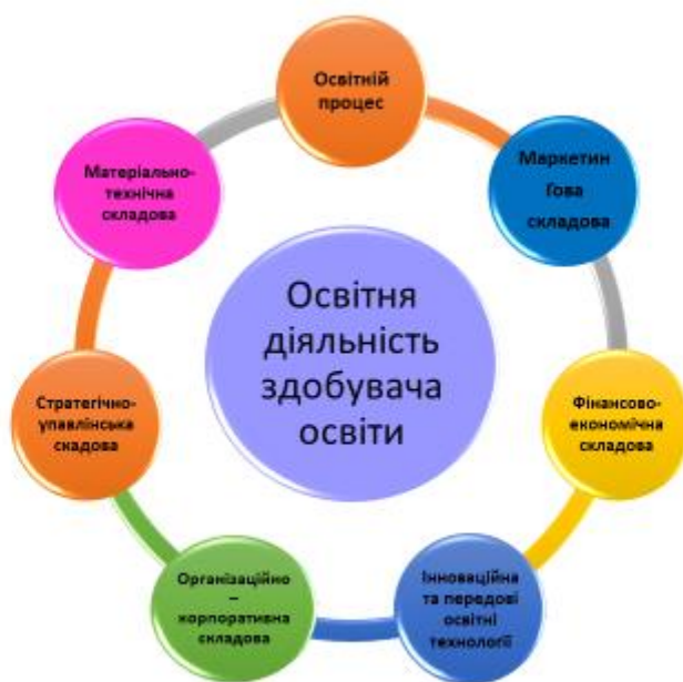
Рис. 2. Складові управління освітньою діяльністю здобувача освіти у закладі загальної середньої освіти в умовах змішаного навчання

Цільова складова, за якою визначається мета, завдання, функціонування та розвиток, яка зумовлює появу у складі моделі освітнього середовища управлінської складової.