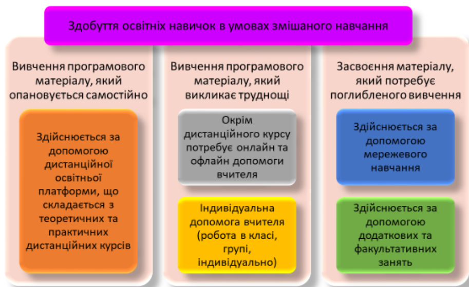
Рис. 1. Здобуття освітніх навичок у закладі загальної середньої освіти в умовах змішаного навчання

Як показано на рис. 1, ми визначаємо три категорії учнів: такі, які вивчають матеріал самостійно за допомогою освітньої дистанційної платформи та спілкуються з учителем лише для оцінки отриманих знань; здобувачі освіти, які потребують спрямування та допомоги вчителя та учні, які за своїм інтелектуальним рівнем потребують додаткових, поглиблених знань. Задовольнити освітні потреби усіх трьох категорій учнів можливо за допомогою змішаного навчання.