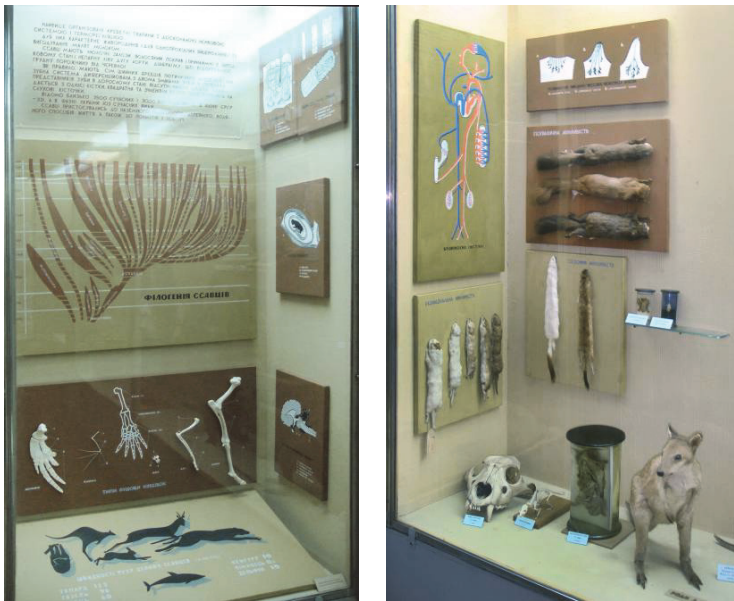
Рис. 2. Сучасний вигляд першої та лівої частини другої вітрин у залі «Ссавці» Зоологічного музею ННПМ НАН України. Ці вітрини монтував Л. Гіренко, і вони не змінювалися з того часу.

Fig. 2. The current look of the first and left parts of the second showcase in the Hall of Mammals of the ZM NMNH NASU. These showcases were designed by L. Hirenko and since they were not modified.