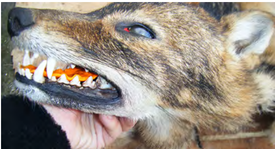
Рис. 1. Голова шакала здобутого біля Тилігульського лиману 22.10.2008 р.

Отримані дані дають підставу говорити про формування осередку розмноження шакалу на материковій частині півдня Миколаївської області в межах Очаківського району. З грудня 2010 р. до грудня 2015 р. там виявлено 43 тварини. Найбільшу зграю, з 9 особин, спостерігали 8.11.2015 р. у пониззях балки Аджигол поблизу с. Солончаки. Зауважимо, що вид знаходиться під значним пресом мисливців, здобуто 34 особини, але чисельність його зростає. В Березанському р-ні виявлено і здобуто лише одну тварину, у 2008 р. Як повідомив нам місцевий таксидерміст, більше фактів здобуття шакалів йому не відомо.