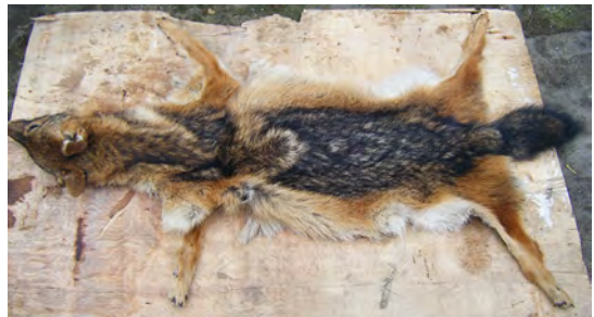
Рис. 2. Шкура шакала, здобутого біля Тилігульського лиману 22.10.2008 р.

Fig. 1. The head of the jackal shot near the Tylihul Estuary on 22.10.2008. Photo by the author.