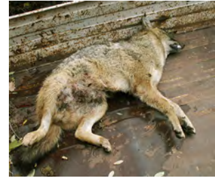
Рис. 5. Шакал, здобутий біля с. Парутине 15.11.2015.

Fig. 4. Jackals shot near Solonchaki on 8.11.2015.