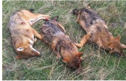
Рис. 4. Шакали, здобуті поблизу с. Солончаки 8.11.2015.

Fig. 3. The jackal shot near Ivanivka on 24.02.2013. Photo by Yu. Patenko.