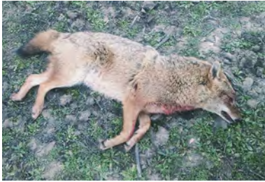
Рис. 3. Шакал, здобутий біля с. Іванівка 24.02.2013.

Fig. 3. The jackal shot near Ivanivka on 24.02.2013.