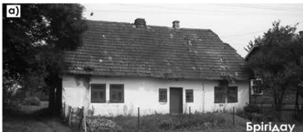
Кол. Бригідау (поч. ХХ ст)

Улюблені фасадні прийоми німецьких колоністів розміщувати поруч на невеликій віддалі два вікна і стрункі пропорції цих вікон 1:1,5 (h), а також обрамлення вхідних дверей парою вікон, через 100 років, в 30-х роках ХХ ст., починає все частіше зустрічатись і в українських хатах. Наприклад, житлові будинки в селах Нове Село, Облазниця, Голубів, Нижні Гаї і ін. Причому ці прийоми зустрічаються і в хатах з традиційно українською планувальною структурою і архітектурою.