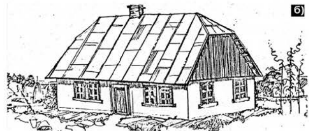
Село Голубів 1932 р.