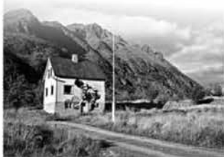
Рис. 1. Граффити. Художники Dolk и Robel. Норвегия. 2008 г.