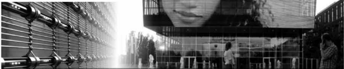
Рис. 6. Медиасетка – в основе лежит сетка с вплетенными с заданным интервалом креплениями для светодиодных трубок