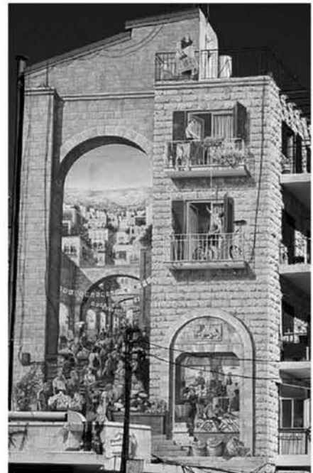
Рис. 4. Граффити. Группа художников «Cite de la creacion». Иерусалим. 2006 г.