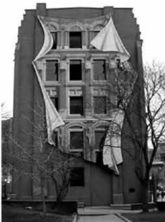
Рис. 2. Бигборд. Торонто