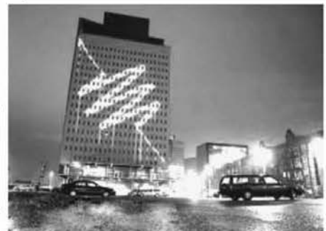
Рис. 5. Лазерное граффити. Объединение Graffiti Research Lab. Роттердам