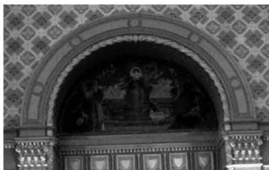
Рис. 3.3. Картина «Торговля»