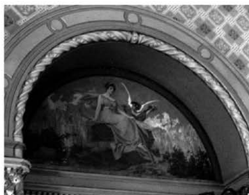
Рис. 2.2 Картина «Земледелие»