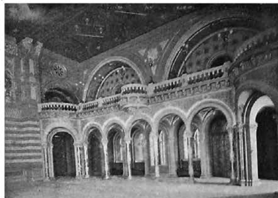
Рис.1. Зал заседаний и Большой зал Новой Биржи