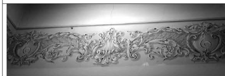
Рис. 8. Музыкальные символы в интерьерах административных помещений