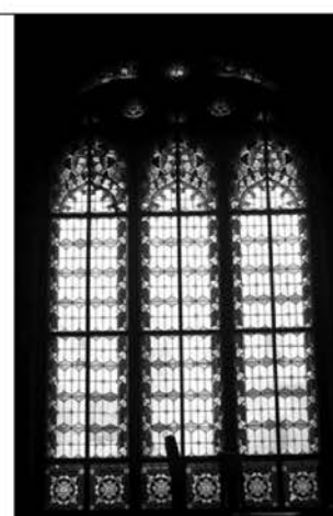
Рис. 5. Окна Большого зала