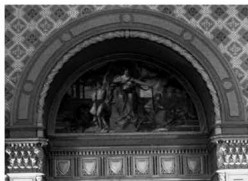
Рис. 3.4. Картина «Промышленность»

Однако, помимо изображений персонификаций в зале, доступных для всеобщего обозрения, не менее интересны портреты еще трех девушек, несущие определенную смысловую нагрузку. Они запечатлены над входом на балкон зала в лестничном холле. На одной из сторон свода изображена девушка с обнаженной грудью и пикторалью, в восточных штанах, с браслетами. Она кокетливо сидит на капители со львами и держит вазу (рис. 3.1). Вторая девушка (рис. 3.2) изображена с мужской стрижкой, в античной тоге, в окружении колеса, топора, плуга и колосьев пшеницы. Третья девушка (рис. 3.3) выглядит довольно интеллектуально, в строгом дамском платье. В одной руке она держит глобус, на другой подвешен большой изящный кошелек. Можно предположить несколько вариантов трактовки этих образов. Согласно первому, это может быть три варианта ведения бизнеса. В соответствии с «нумерацией дам»: