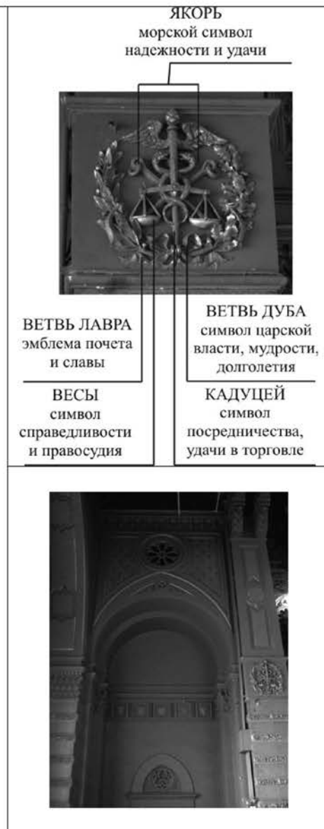
Рис. 7. Элемент декора сцены