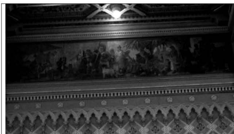
Рис. 4. Картина художника Каразина в Большом зале

На первой изображены колосья пшеницы, символизирующие изобилие и плодородие, трезубец, олицетворяющий власть над стихией воды и, наконец, весы, говорящие о справедливости заключенных сделок (рис. 6.1).