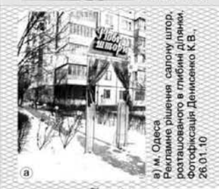
м. Одеса. Рекламне рішення салону шпору, розташованого в глибині ділянки. 26.01.10