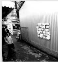
м. Черкаси. Виділення рекламної площі для приватних оголошень городян на боковому фасаді торговельного павільйону на ринку "Садова". Фотофіксація автора, 16.10.09.