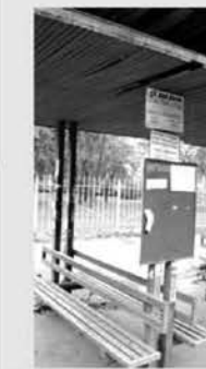
м. Черкаси. Виділення рекламної площі для приватних оголошень городян на фасаді зугиного павільйону Парк Хіміків. 16.10.09.

Для ефективної боротьби з хаотичним обклеюванням міських об'єктів об'явами пропонується одночасні комплексні заходи: -заборону, з організацією контролюючих та штрафуючих служб міськвиконкому; -створення бар'єрів, перепон, які зроблять неможливим або затрудненим обклеювання об'єктами поверхонь об'єктів; -виділення спеціальних БЕЗКОШТОВНИХ площ для об'єктів городян. Подібні приклади вже зустрічаються, але все сказане повинно стати чіткою і жорсткою, а головне, комплексною міською політикою.