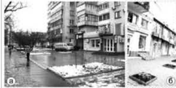
а) м. Черкаси. Знищення потужного "зеленого щита" між бульваром Шевченка та житловою забудовою задля "Серопейського" дизайну та відкриття фасадів новостворених на перших поверхах торговельних закладів. 2008 р. б) м. Одеса. вул. Торгова. 2009 р.

Вирубання дерев перед фасадами реконструйованих на 1-му поверсі під магазини житлових приміщень, зменшення площ зелених насаджень, є неприпустимим за умов сучасної тотальної автомобілізації, критичного забруднення повітря викидами автомобільних двигунів та промисловості.