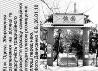
б) м. Одеса. Збереження озеленення на ділянці та відсутність радикального розкриття фасаду комерційної споруди шляхом розміщення площі перед нею. 26.01.10

Зменшення площ озеленення міста в умовах збільшення забруднення повітря і погіршення екологічного стану населених пунктів вимагає пошуків додаткових площ озеленення, відновлення широкого застосування зелених огорож, які мають не лише естетичне, але і важливе психологічне, санітарно-гігієнічне і технічне значення, створюють відчуття комфорту (бо для людини є необхідною близькість до природи), і є засобом неперетворення міста у мертвені кам'яні джунглі. Зелені огороження мають велике значення в якості захисних засобів від руйнівного впливу техногенного середовища, згідно концепції "Бар'єрного середовища" К. Денисенко.