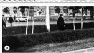
а) Зелені огороження на бульварі, напроти Обкому (Будинку рад). Фрагмент фото кінця 1950-х - початку 1960 рр., з колекції Черкаського обл. управління архітектури. б) "Зелені стіни", що збереглися з радянських часів на ар'єрплоті Будинку рад, добре захищають від міської метушні і роблять сквер бажаним і приємним місцем для відпочинку

Зменшення площ озеленення міста в умовах збільшення забруднення повітря і погіршення екологічного стану населених пунктів вимагає пошуків додаткових площ озеленення, відновлення широкого застосування зелених огорож, які мають не лише естетичне, але і важливе психологічне, санітарно-гігієнічне і технічне значення, створюють відчуття комфорту (бо для людини є необхідною близькість до природи), і є засобом неперетворення міста у мертвені кам'яні джунглі. Зелені огороження мають велике значення в якості захисних засобів від руйнівного впливу техногенного середовища, згідно концепції "Бар'єрного середовища" К. Денисенко.