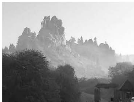
Мал. 2. Загальний вигляд скель Тустані [10]