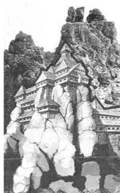
Мал. 4. Укріплення Тустані