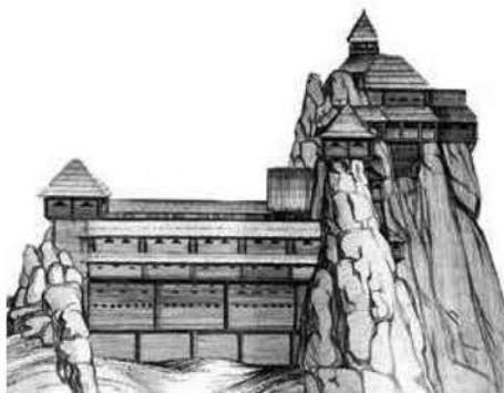
Мал. 5. Графічна реконструкція фортеці Тустань (за М. Рожко) [12]

Перші оборонні кам'яно-дерев'яні стіни зведені в IX ст. Вони реставрувалися і додатково укріплювалися до початку 40-х років XIII століття, до Батія, тобто майже 400 років. Однак, за деякими джерелами, фортеця існувала до XVI століття, тобто термін її існування майже 700 років. Така довговічність забезпечувалася, по-перше, її стратегічним місцем (на одному з головних шляхів на Захід зі Східної Європи), по-друге, її недоступністю. Тільки зміщення торговельних шляхів за кордони даної місцевості було причиною руйнування та занедбаності фортеці [7, с. 1]. Археологи прийшли до висновку, що скелі були забуті з часів існування святилища протягом майже 1,5 тис. років, до IX ст. н. е., коли знову стали потрібні білим хорватам для побудови на них фортеці [12]. До середини I тис. н. е. білі хорвати об'єдналися в прослав'янський союз і їхні землі розташувалися на територіях сучасних України, Польщі, Словачії, Угорщини. Про білих хорватів згадують літописи від