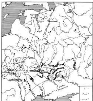
Мал. 1. Карта Русі IX –XI ст. [1, с. 117]

Оточуюча рівнинна місцевість ідеально проглядається з поверхів скальної групи, а самі поверхи менш вразливі з боку рівнини [7, с. 2, 15], мал. 2.