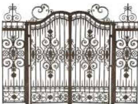
Рис. 2. Пример кованых ворот, выполненных в период стиля архитектурной эклектики – ул. Троицкая, 35, арх. Л. Ц. Оттон, 1875 г.

Композиция орнамента ворот времен архитектурного стиля эклектики выглядит как ювелирное украшение всего ансамбля здания. На поверхности фасада выделяется затейливый рисунок кованых деталей, а фактура наружных стен служит фоном, экраном для восприятия причудливых узоров. Порой металлический орнамент ворот своим рисунком даже спорит по значимости с архитектурными формами фасада.