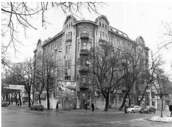
Рис. 9. Будинок на вулиці Єкатерининській, 35

Неоампір виглядає менш авангардно, зате більш витончено завдяки використанню традиційних елементів античної архітектури – колон, пілястр, арок. Прибутковий будинок Рудь на Кузнечній, 42, збудований за проектом Фелікса Кюнера в 1913 році, примітний чіткістю і гармонійністю вертикального і горизонтального поділу простору. Елементи декору чітко прив'язані до вікон і різні для кожного поверху. Верхній поверх над парадними входами прикрашений невибагливими напівколоннами, які немовби підтримують сильно виступаючий карниз.