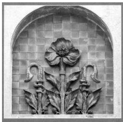
Рис. 3. Елемент рослинного орнаменту