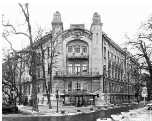
Рис. 5. Прибутковий дім Луцького