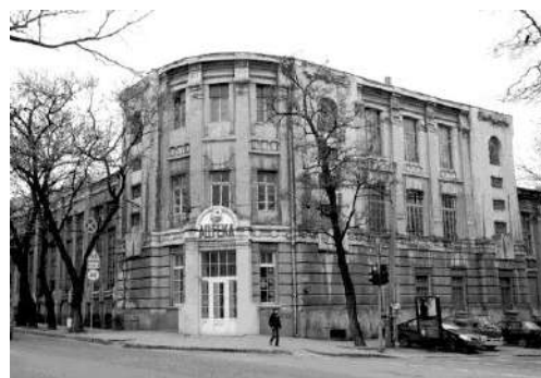
Рис. 2. Чаєфасовна фабрика на розі Троїцької і Канатної