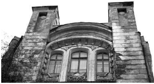
Рис. 7. Барельєф дому Вуфгарт