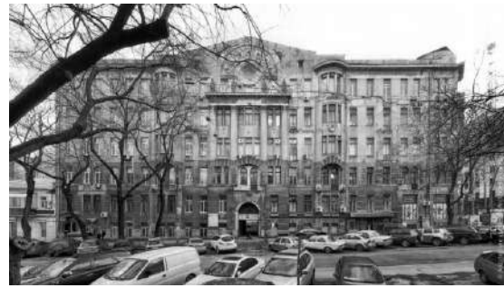
Рис. 8. Будинок Асвадурова

Знайомство з європейськими школами модерну виникло до життя кілька потужних напрямків, кожен з яких залишив великий слід в одеській архітектурі. Перш за все, це раціональний модерн, модернізований ренесанс, неоампір і неоготика.