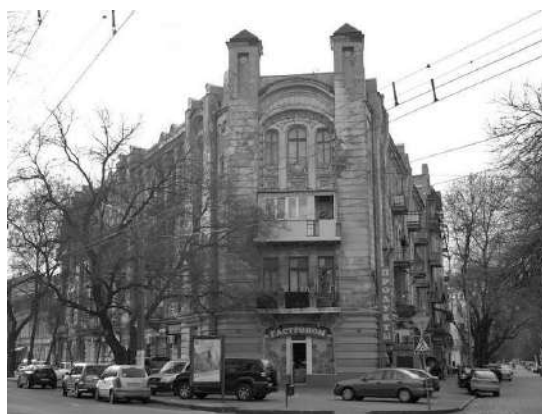
Рис. 6. Прибутковий дім Вуфгардт