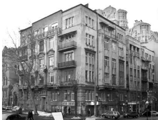
Рис. 10. Будинок Маргуліс