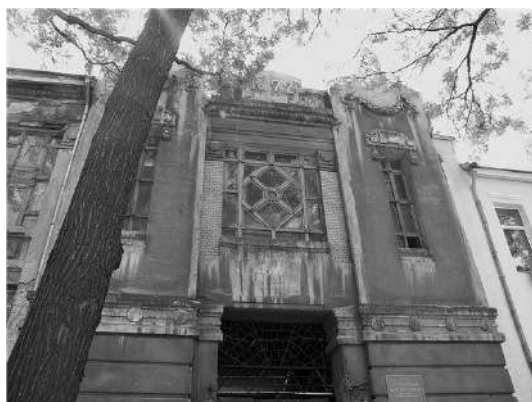
Рис. 4. Елемент мозаїчного панно