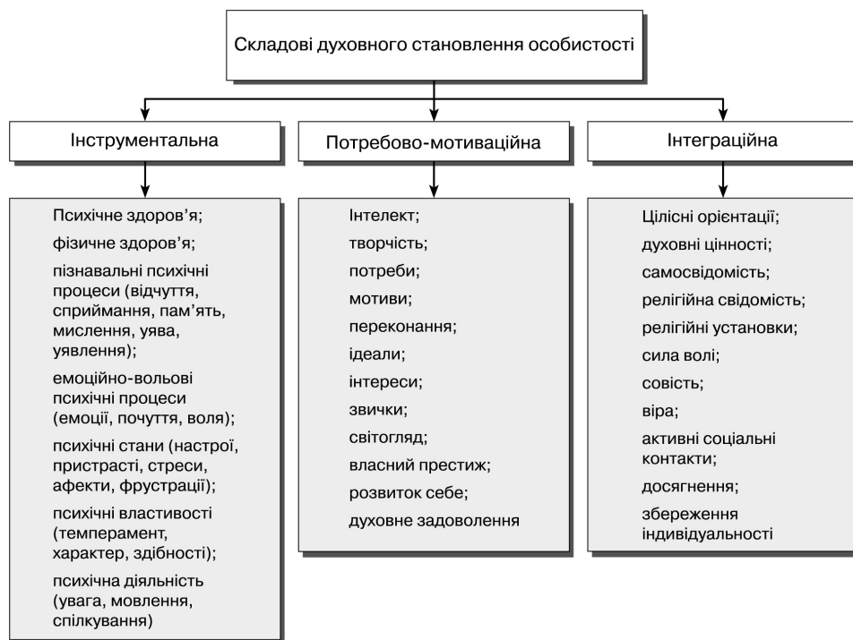
Рис. 2. Авторська модель духовного становлення особистості

зорієнтованого тренінгу, лекції, наукові семінари, круглі столи, конференції, прощі, реколекції тощо.