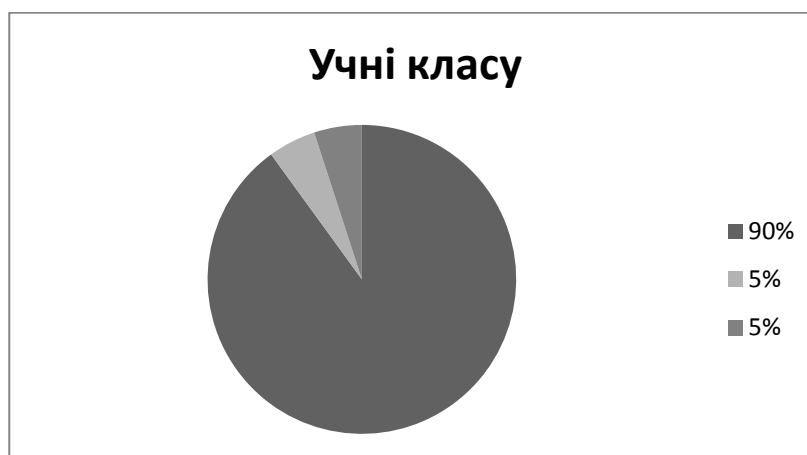
Рис. 2. Результати дослідження волі у молодших школярів за методикою «Графічний диктант»

Отже, поняття вольової регуляції ще не досконало вивчене та має недостатнє підґрунтя у теоретичних та емпіричних дослідженнях. Не достатньо вивчені питання включення вольової регуляції у соціальну взаємодію і вплив соціальних відносин на формування вольових якостей у дітей молодшого шкільного віку. Встановлено, що під впливом розвитку вольових якостей у дітей даного віку відбувається перебудова їх зовнішніх та внутрішніх способів саморегуляції.