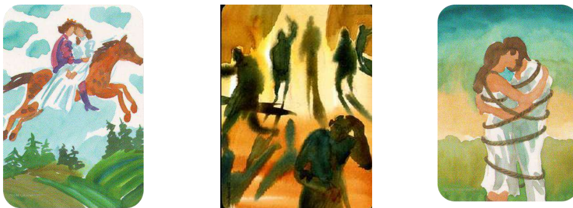
Рис. 3. Малюнок військовослужбовця А. де зображена історія його стосунків із дружиною

Під час консультації на прохання зобразити історію свого кохання – обрав наступні метафоричні картки (рис.3.).