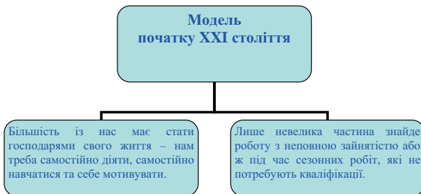
Схема 2. Модель навчання початку XXI століття