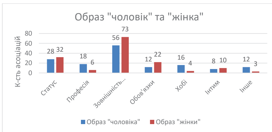
Рис. 1. Асоціації до образу «чоловік» і «жінка» по категоріях (відповіді українців)

Поняття «жінка» (рис. 3) набрало найбільшу кількість асоціацій по трьох категоріях: «Зовніш-