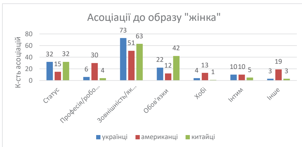
Рис. 3. Асоціації до образу «жінка» по категоріях