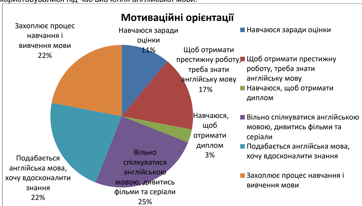
Рис. 2. Мотиваційні орієнтації вивчення англійської мови (після закінчення експерименту)

Наприкінці експериментальної роботи, було проведено два опитування: (1) спрямоване на з'ясування провідних мотивів навчання здобувачів вищої освіти, аналогічно попередньому (рис. 2); (2) метою якого було визначення ставлення здобувачів вищої освіти до мобільних додатків та месенджерів, що використовувалися під час вивчення англійської мови.