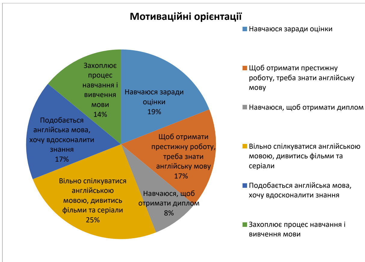
Рис. 1. Мотиваційні орієнтації вивчення англійської мови (до початку експерименту)

Так, для визначення мотивів, освітньої діяльності здобувачів першого (бакалаврського) рівня вищої освіти спеціальності «014 Середня освіта. Мова і література (англійська)» 1-го року навчання, нами було проведено опитування. Запитання анкети були сформульовані таким чином, щоб визначити, який вид мотивів (внутрішні чи зовнішні) переважають у респондентів. Результати опитування подано на діаграмі (рис.1).