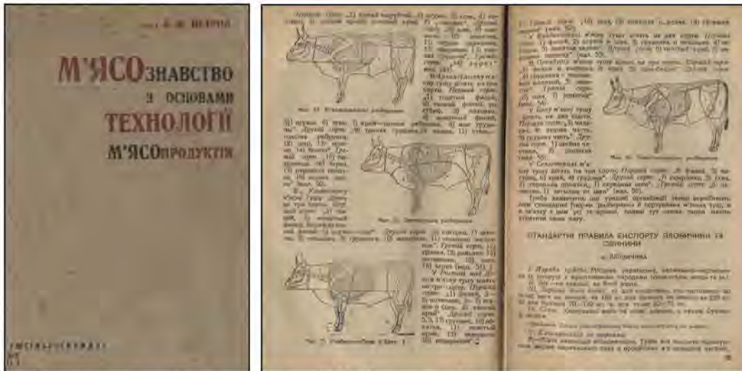
Перший підручник українською мовою О.М. Петрова «М'ясознавство з основами технології м'ясних продуктів» (1932 р.)

1932 р. видрукував перший підручник українською і російською мовами «М'ясознавство з основами технології м'ясних продуктів», який тривалий час залишався основним підручником для студентів ветеринарних факультетів України.