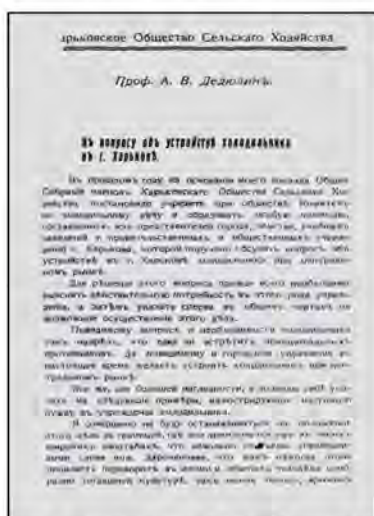
Робота професора О.В. Дедюліна «К вопросу об устройстве холодильника в г. Харькове»

Професор О.В. Дедюлін мав більше 180 опублікованих робіт. О.В. Дедюлін як вчений, педагог, організатор ветеринарної справи в Україні відіграв велику роль у тому, щоб Харківський ветеринарний інститут став провідним ветеринарним закладом країни.