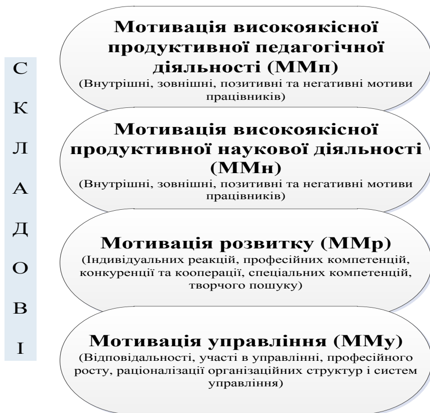
Рис. 2. Структура мотиваційного механізму управління компетенціями персоналу ВНЗ