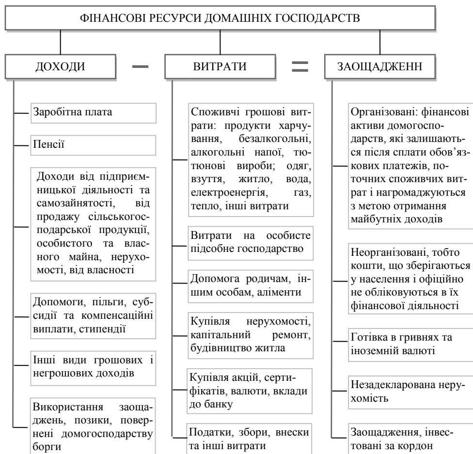
Рис. 1. Структура фінансових ресурсів домашніх господарств

і неорганізовані, які в силу різних причин не обліковуються в офіційній економіці і не враховуються в статистичній звітності.