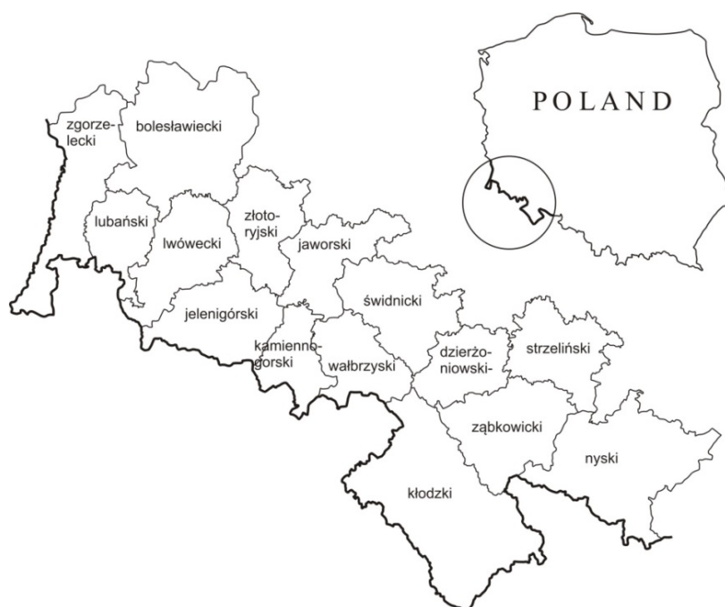
Rys. 1. Orientacyjna mapa regionu Sudetów na tle podziału administracyjnego (powiaty)

Istotnym atutem regionu są również zasoby walorów dziedzictwa kulturowego. Do czynników historyczno-kulturowych szczególnie sprzyjających rozwojowi turystyki należą liczne obiekty architektury poindustrialnej, muzea i skanseny, stanowiska archeologiczne, zabytki sakralne o znaczeniu międzynarodowym, relatywnie gęsta sieć miast o bezcennej historycznej zabudowie, górskie i podgórskie miejscowości turystyczne z XIX-wiecznymi tradycjami letniskowymi i charakterystyczną stylową zabudową sanatoryjno-pensjonatową.