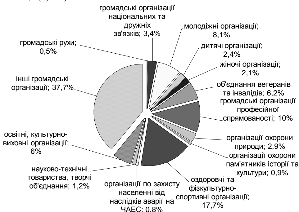
Рис. 1. Структура позитивного соціального капіталу (громадських організацій) в Україні 1 за спрямуванням та видами діяльності у 2014 р., у % до загальної кількості [7]

За даними Державної служби статистики України (далі – Держстатслужба України), на кінець 2014 р. у структурі соціального капіталу в Україні зареєстровано: 233 політичні партії та 251956 їх структурних утворень; 61090 центральних органів громадських організацій (з них 701 – із всеукраїнським статусом); громадських спілок – 718; професійних спілок – 4143, об'єднань профспілок – 1130 та благодійних організацій – 9799, з яких 89,9% становили благодійні фонди, 4,8% – благодійні установи та 5,3% – благодійні товариства [7]. Найбільша питома вага в структурі соціального капіталу в Україні за спрямуванням і видами діяльності (Рис. 1) припадала на оздоровчі та фізкультурно-спортивні організації (17,7%), громадські організації професійної спрямованості (10 %) та молодіжні організації (8,1 %).