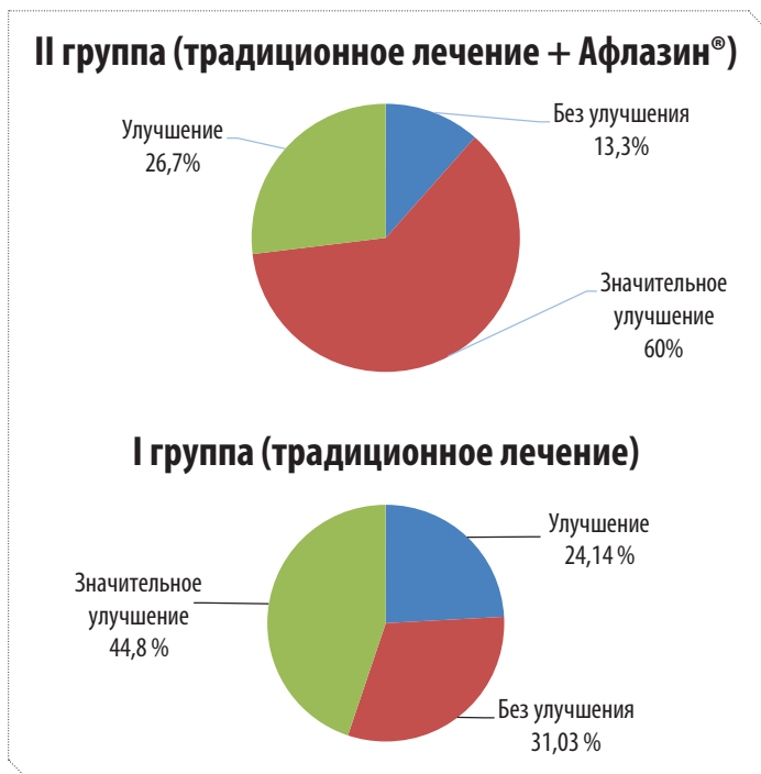
Рисунок 3. Эффективность терапии у беременных с СД и ИМС

мочи (общего и по Нечипоренко), снижается температура тела. В то же время у беременных основной группы улучшение общего состояния наступает на 5–6 сутки лечения и полной нормализации показателей анализов мочи, как правило, не происходит.