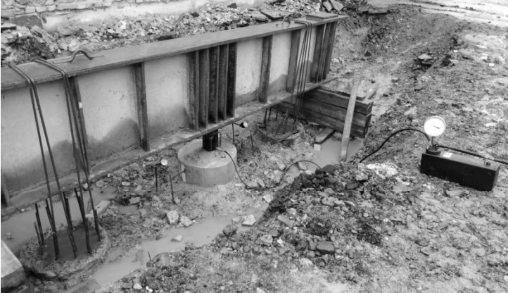
Рис. 3. Стенд для статичного випробування палів.

Ступені навантаження склали 5 тс. Вимірювання осідань випробувальних палів виконувався за допомогою прогиномірів 6 ПАО, закріплених на незалежній реперній системі. За критерій умовної стабілізації деформацій основи палі прийнята швидкість осідання, що не перевищувала 0,1 мм за годину спостережень.