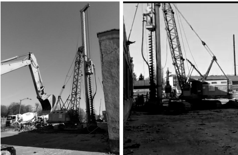
Рис. 2. Установка для буріння та бетонування паль.

Випробування паль проводилося до навантаження, рівного 45 тс, але не менше величини, що викликає граничне осідання [5, 8], та проведено згідно методики ДСТУ Б В.2.1-27:2010 «Основи та фундаменти споруд. Палі. Визначення несучої здатності за результатами польових випробувань».