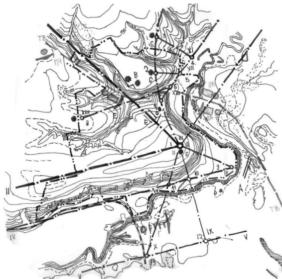
Рис. 2. г. Чугуев, ландшафтно-композиционная структура

Композицию Чугуева в значительной степени определил ландшафт. Его общим признаком является контрастное отношение пойменных территорий Северского Донца и активных, более высоких, изрезанных оврагами форм рельефа правобережной части города (рис. 2).