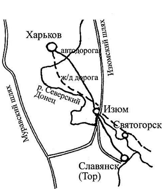
Рис. 3. г. Изюм, схема путей сообщения. Древние пути и современное состояние

та, исторических путей движения и исторических архитектурных доминант. Их взаимозависимость как важный композиционный фактор нуждается в серьезных исследованиях и должна рассматриваться как основа для дальнейших градостроительных разработок.