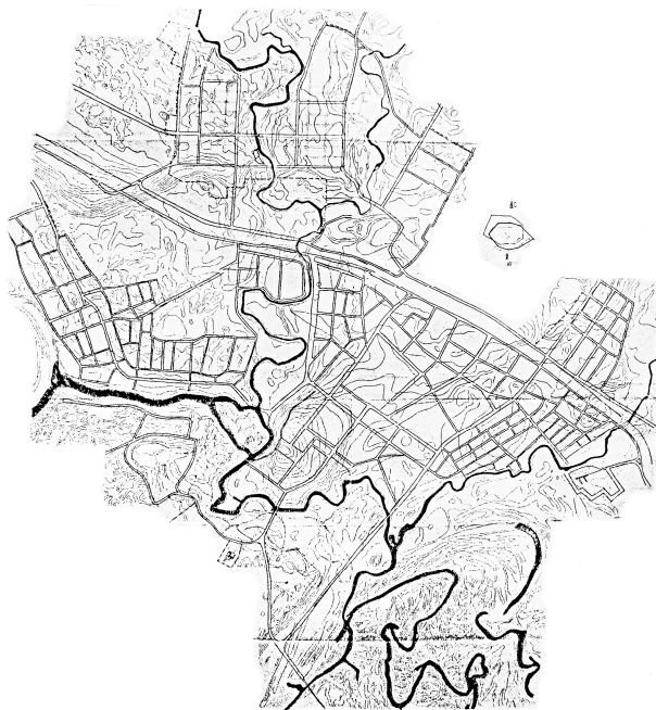
Рис. 1. г. Балаклея, генеральный план 1992 г.

Основу планировочной структуры города образует направление главной городской магистрали, объединяющей два основных городских района: исторический —