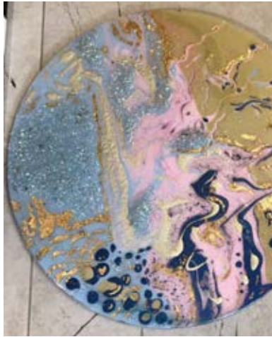
Флюид Свидерская А.С.- 2019 г.