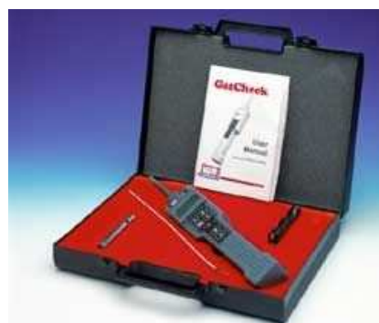
Рисунок 5 – Газовий детектор GasCheck

GMA 36 Pro є новою інтелектуальною системою з гнучким управлінням та настінним кріпленням. Система здатна фіксувати витoki різних токсичних газів, в тому числі і природ-