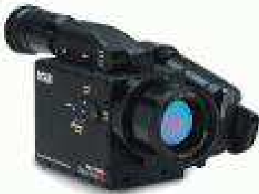
Рисунок 6 – Інфрачервона камера ThermaCAM GasFindIR

ThermaCAM GasFindIR – інфрачервона камера для швидкого виявлення витоків природного газу (рис. 6).