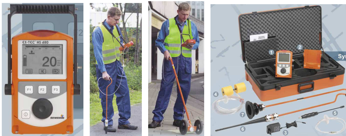
Рисунок 4 – Засоби контролю витоків газу серії EX-TEC

проводу пробивають (пробурюють) отвори – свердловини. Глибина свердловини визначається глибиною залягання газопроводу. Діаметр свердловини не має практичного значення і рівний 20–40 мм. Свердловина призначена для створення шляху виходу газу з ґрунту в атмосферу. При наявному витокі, газ часто виявляється в декількох свердловинах, а місце витoku газу визначають за свердловиною з найбільшою концентрацією газу на поверхні. Концентрація залежить від об'ємів витoku і відстані до місця витoku газу з газопроводу. Концентрація газу визначається за допомогою приладів – газоаналізаторів.