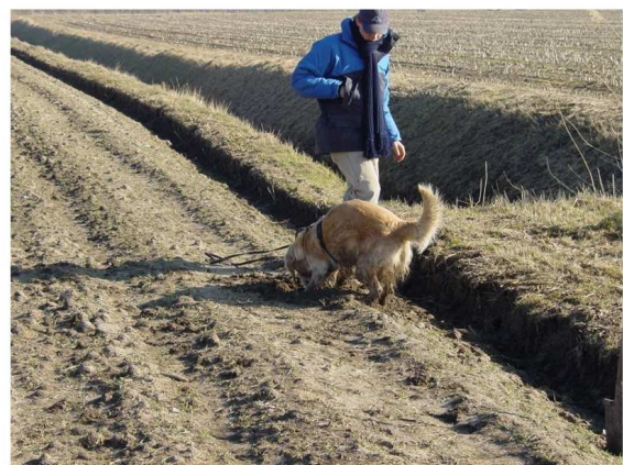
Рисунок 3 – Тренування собак

кисню, який визначає ділянки з низьким значенням його вмісту, дозволяє комплексно підвищити точність місцезнаходження витoku природного газу з газопроводу [7].