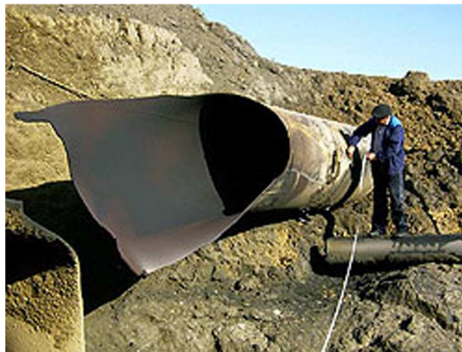
Рисунок 1 – Наслідки аварії на газопроводі, спричинені витокami газу

які перевищують границю плинності металу і спричиняють його розрив.