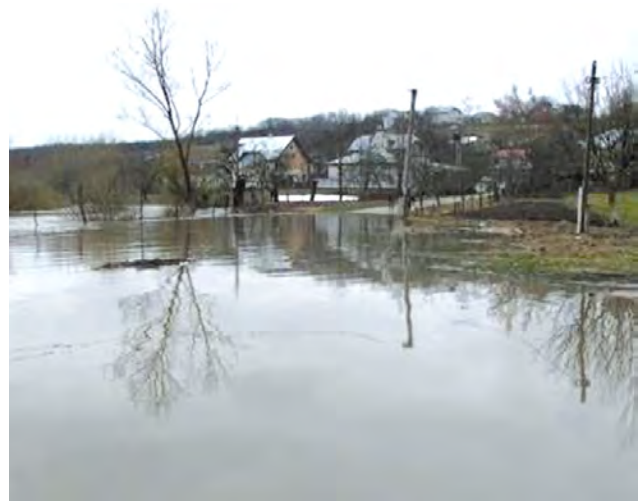
Рис. 1. Весняний паводок на р. Ворона

На рис. 2 показано фрагмент проекту ємкості № 7 (пригребельна частина). Червоною лінією проведено контур затоплення, який розрахований на висоту максимального підпірного рівня греблі (чорна лінія).