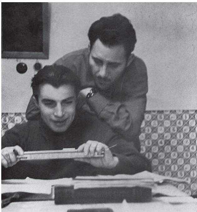
Під час навчання