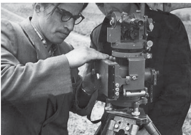
За роботою у Луцькому педінституті

Під його керівництвом виконано низку госпдоговірних тем: “Динаміка ерозійних процесів та міграція радіонуклідів в умовах Волині”; “Геодезичні спостереження за осадками та деформаціями промислових споруд (ДПЗ-28)”; “Обґрунтування точності та періодичності інженерно-геодезичних спостережень деформацій промислових споруд”; “Математико-картографічне моделювання динаміки ерозійних процесів та площинного змиву гумусного шару в ґрунтозахисній системі землеробства”; “Інженерно-геодезичне забезпечення експлуатаційного режиму промислових споруд Луцького КХП-2”; “Інженерно-геодезичне забезпечення експлуатаційного режиму греблі водосховища ХАЕС”.