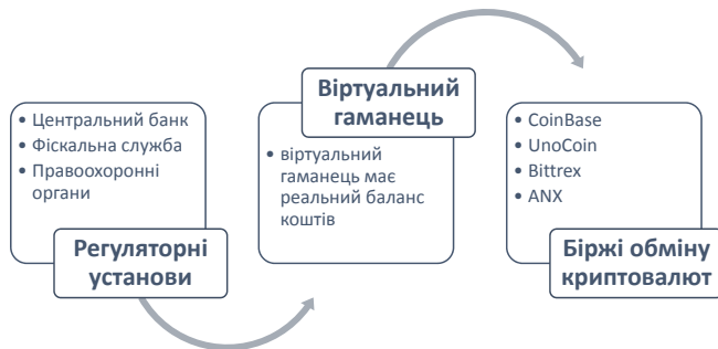
Рис. 3. Регулювання обігу криптовалюти у країні Власна розробка.

У зв'язку з тим, що виробництво (майнінг) криптовалюти є децентралізованим, вважаємо що регулювання повинно здійснюватись через контроль віртуального гаманця власника такої валюти (рис. 3).